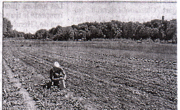
■ Pour l'achat des premiers légumes, rendez-vous au lieu-dit Les Millières à Brignac.

► Pour plus d'infos sur la sélection de produits disponibles et les prix, il faut contacter Elsa Vicente au 06 66 49 30 62. Courriel : elsa.vicente@live.fr